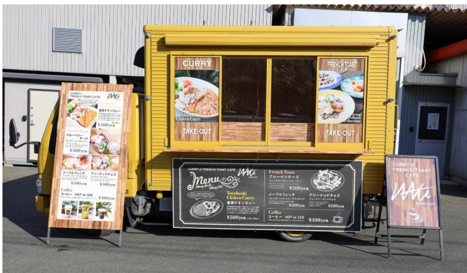
新キッチンカー『WAKU CAFE』外観デザイン

また、「オープン2周年記念キャンペーン」を、2023年5月2日（火）～2023年5月7日（日）までの期間限定で開催致します。