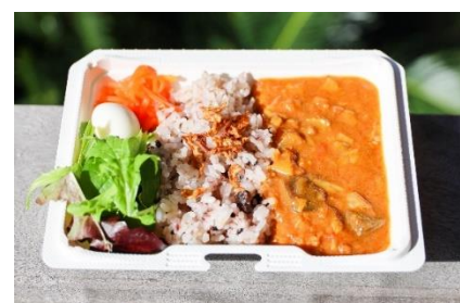
カレーメニュー『豊橋チキンカレー』