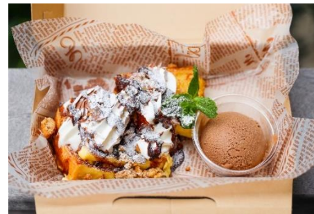
『フレンチトースト(アソートチョコ) 500円』

チョコレートシロップにチョココープ、チョコアイスとチョコ好きにはたまらない一品です。