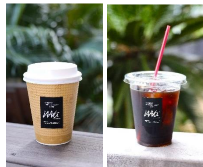
『コーヒー(ホットorアイス) 400円』

チョコレートシロップにチョココープ、チョコアイスとチョコ好きにはたまらない一品です。