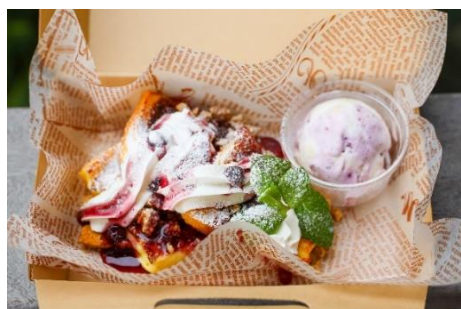
『フレンチトースト(ブルーベリーチーズ) 500円』