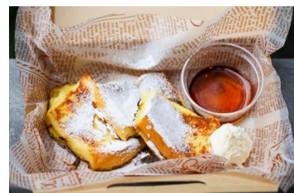
フレンチトーストメニュー『メープルフレンチ』