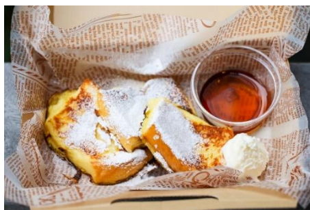
『フレンチトースト(メープルフレンチ) 400円』

豊橋産の食材(鶏肉・トマト・キャベツ・うずら卵)をたっぷり使用したご当地カレーです。