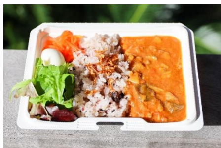
『豊橋チキンカレー 500円(大盛+100円)』

豊橋産の食材(鶏肉・トマト・キャベツ・うずら卵)をたっぷり使用したご当地カレーです。