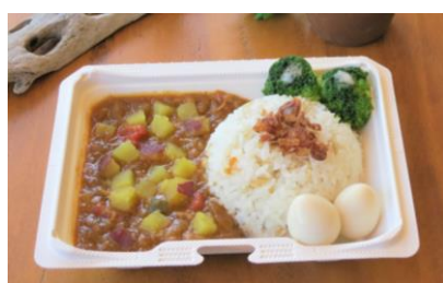
【スイートポテト！豊橋チキンカレー 700円】