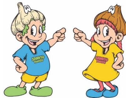
三共食品 オリジナルキャラクター「リッキー」と「ルイ」

法人名： 三共食品株式会社 代表： 代表取締役 中村 俊之 所在地： 愛知県豊橋市老津町字後田 25 番地の 1 電話： 0532-23-2361 設立： 1975 年 12 月 3 日 事業内容： 乾燥野菜、天然調味料エキス、オイルフレーバー、乾燥食品、 業務用食品の製造・販売 ホームページ： https://sankyofoods.co.jp/