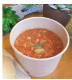
【野菜食べる！ミネストローネ 500円】