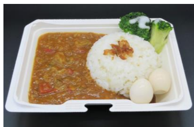
【コク旨！豊橋チキンカレー 700円】