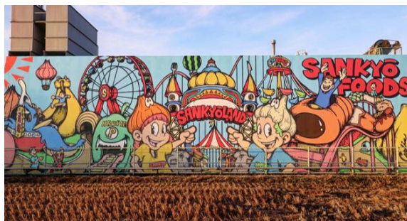
【「食のテーマパーク」イメージ壁画】