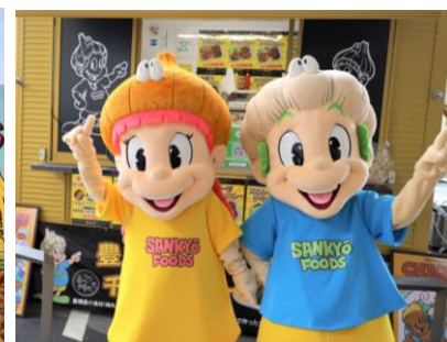
【当社オリジナルキャラクター】