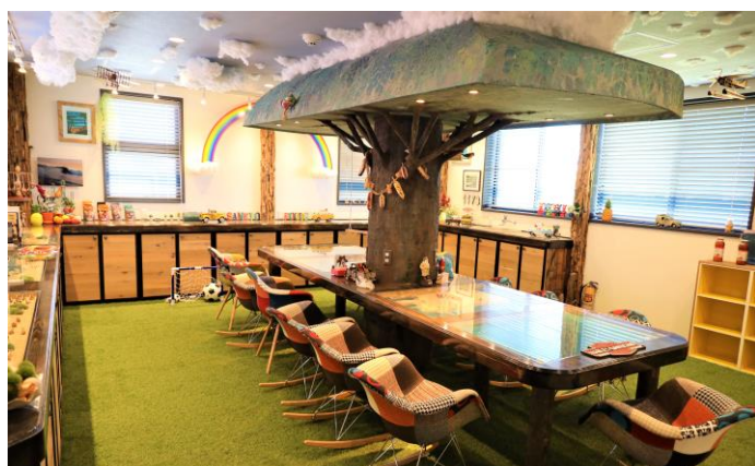
【ミーティングルーム】

（本日12月16日より三共食品集大成は当社HP：「新着情報」にて公開します。URL： https://sankyofoods.co.jp/info/2021-12-16/ ）