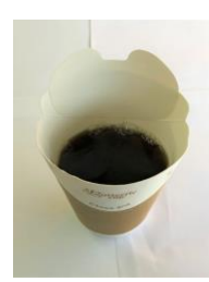
【有機栽培コーヒー 200円】